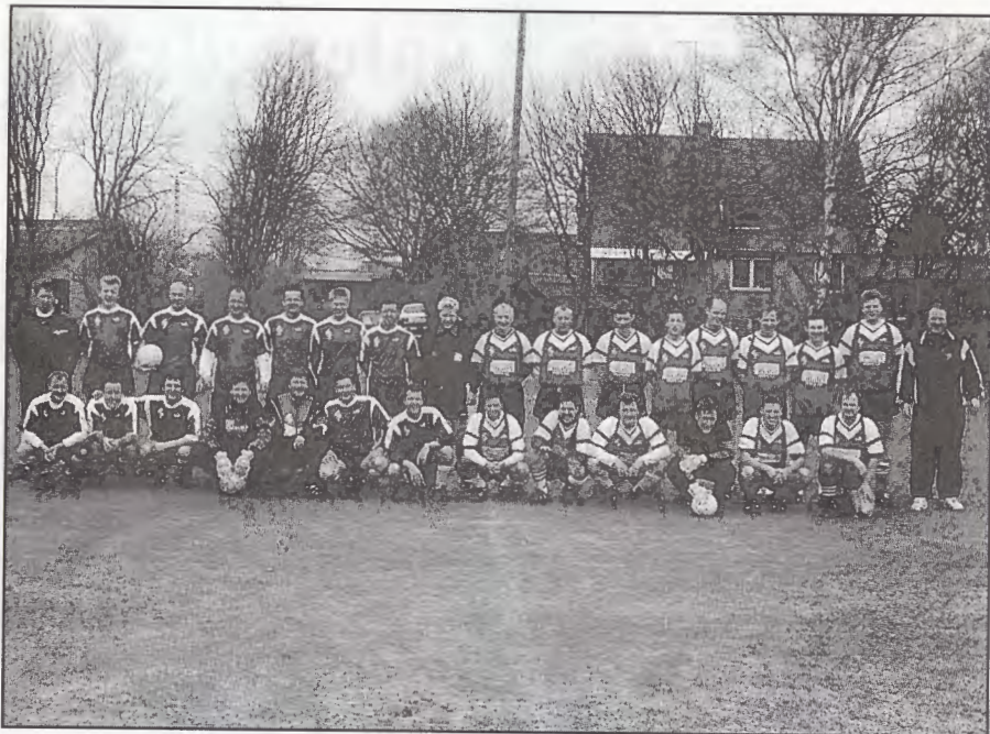
De to rasende veltrimmede mandskaber, flankeret af holdlederne og med dommeren som dyden i midten.