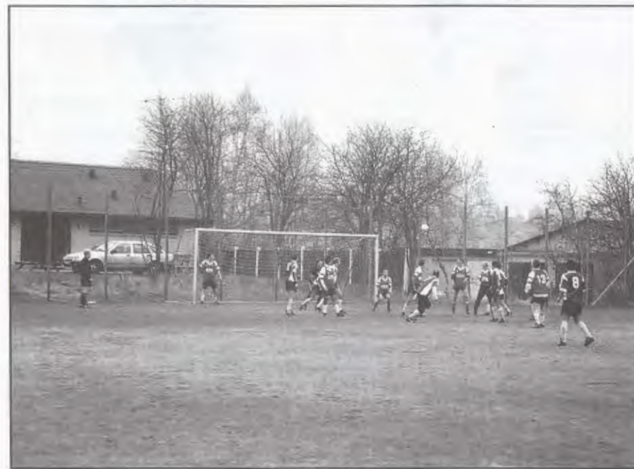
Et atypisk billede fra prestigeopgøret. Serie 4.1 presser alvorligt på foran underhundredes mål.