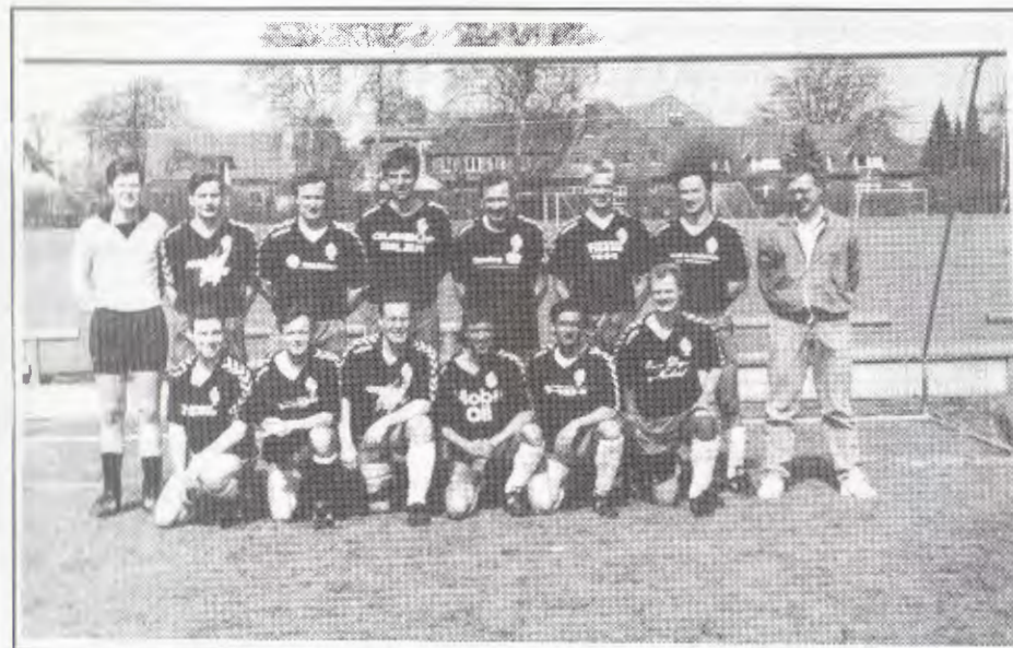
Klubbens succesrige serie 4-hold.