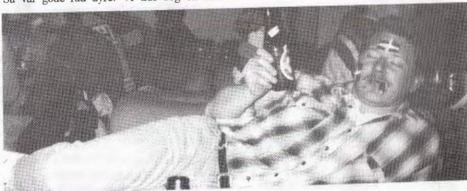
Kent nyder cigaren på færgen efter sejren